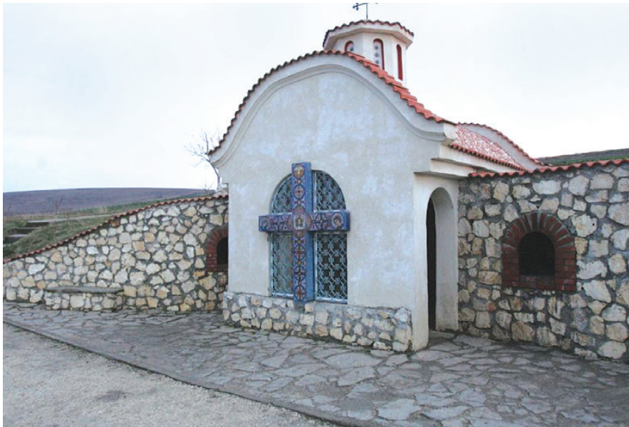
Izvorul Sfântului Andrei, Derwent, județul Constanța

Baptisteriile erau construcții speciale, ridicate lângă biserici și destinate exclusiv Botezului. Acestea au devenit, în timp, mărturii tăcute ale unui obicei dat uitării. În zilele noastre copiii sunt botezați într-un vas special, numit cristelniță .