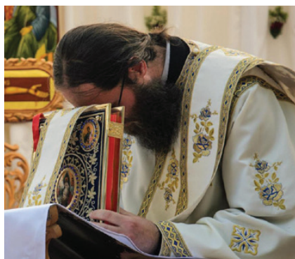
Diacon cu Sfânta Evanghelie