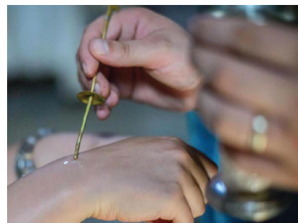
Taina Sfântului Maslu

Fiule! În boala ta nu fi nebăgător de seamă; ci te roagă Domnului și El te va tămădui. (...) Și doctorului dă-i loc că și pe el l-a făcut Domnul și să nu se depărteze de la tine, că și de el ai trebuință.