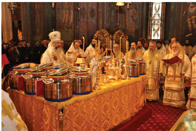
Sfântul și Marele Mir – slujba de sfințire

În timpul săvârșirii slujbei Sfintei Liturghii, la rugăciunea specială a preotului, numită epicleză, partea văzută a Sfintei Împărtășanii , pâinea și vinul, se prefac în chip tainic, nevăzut, în Trupul și Sângele Domnului. Dintre roadele Sfintei Împărtășanii fac parte primirea harului divin, creșterea și întărirea sufletească, unirea cu Hristos.