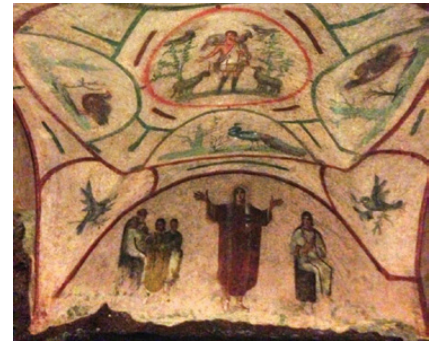
Fresce din Catacomba Priscillei, Roma (Italia)

Citește textele, privește imaginile și răspunde la întrebări: