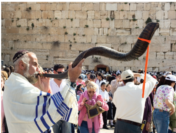
Ziua ispășirii la evrei (Yom Kippur), sărbătoare anunțată prin sunetul șofarului (corn de berbec).

• Așadar, în toate aceste situații, animale nevinovate erau aduse ca jertfe, fără ca oamenii să se schimbe și să devină mai buni. Mântuitorul Hristos a fost cel mai mare Arhiereu, deoarece S-a adus pe Sine jertfă pe Cruce, împăcând pe om cu Dumnezeu pentru totdeauna. Prin Preoția instituită de El, care va rămâne până la sfârșitul veacurilor, ne-a lăsat darul Sfințelor Taine, spre iertare, vindecare trupească și sufletească.