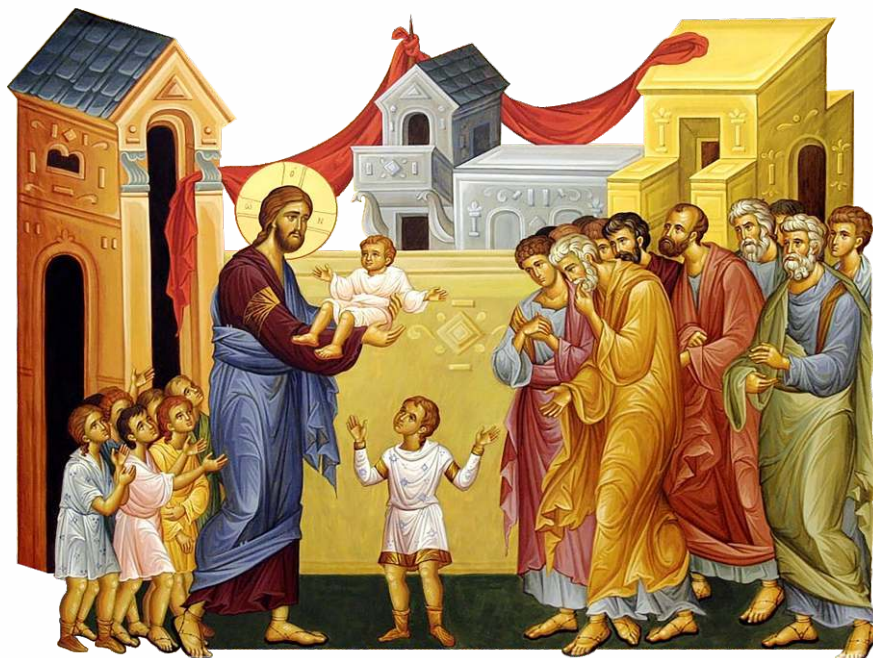
Iisus binecuvântează copiii

Domnul Iisus Hristos S-a rugat deseori Tatălui Ceresc pentru întreaga lume. În predicile Sale, El a întărit importanța rugăciunii către Dumnezeu Tatăl: „Adevărat, adevărat zic vouă: Orice veți cere de la Tatăl în numele Meu El vă va da” (Ioan 16, 23).