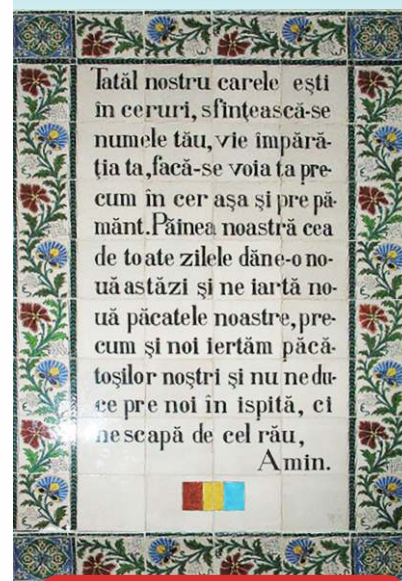
Placă din biserica „Pater noster”

Rugăciunea Domnească se poate spune în orice împrejurare a vieții. Sfânta Biserică o întrebuințează la toate slujbele religioase și în mod special la Sfânta Liturghie, când o rostim sau o cântăm cu evlavie, împreună cu întreaga comunitate a credincioșilor.