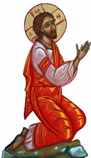
Iisus Hristos, model de rugăciune